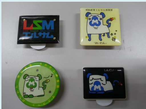
エポキシ付 LEDバッジ