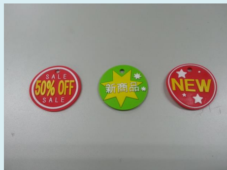
PVC(塩ビ)製作による凹凸バッジ用ラバー